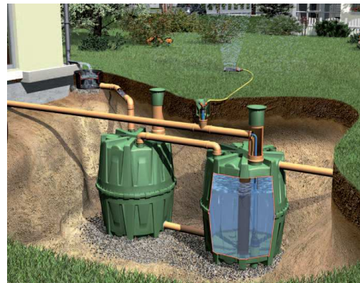
Kompletný systém Herkules Garden s 2 nádržami.